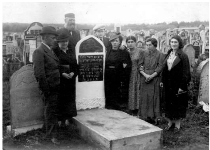
Pogrzeb na nowym cmentarzu żydowskim w Olkuszu, lata 30.

aż tak bardzo oszukiwali? Czy byli tak bardzo nieuczciwi i okradali chłopów, i w ogóle Polaków? Czy właśnie dlatego byli tak nielubiani, a nawet nienawidzeni? Czy Żydzi rzeczywiście nie dopuszczali Polaków do handlu i urzędów? – drążyłem. Babcia zastanowiła się przez kilka chwil, aż w końcu odparła: